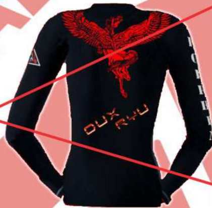
LEYENDA DUX RYU NOMBRE PERSONALIZADO