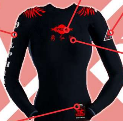
KANJIS CORAJE BENEVOLENCIA SABIDURÍA