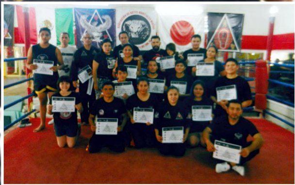
Arriba: Foto Grupal de los participantes del seminario

La parte física se dividió en tres áreas de combate: Rango de Golpeo, Rango de Sujeción y Rango de Combate Armado. En el Rango de Golpeo se enseñó a los participantes a atacar a las áreas primarias de golpeo, a seleccionar el blanco más efectivo y el arma (corporal) más apropiada para