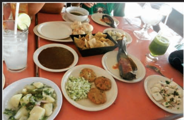
Arriba: El delicioso menú en en Puerto Progreso.