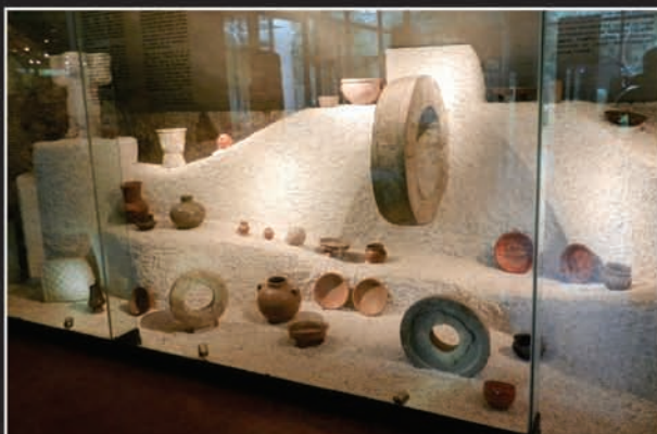
Arriba: Museo de Sitio de Dzibilchaltún.