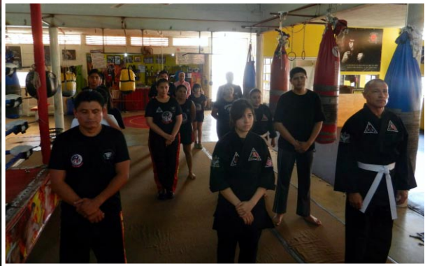
Arriba: El grupo de participantes alineados esperando el inicio del 1er Seminario de Defensa Personal en el Sport Planet.