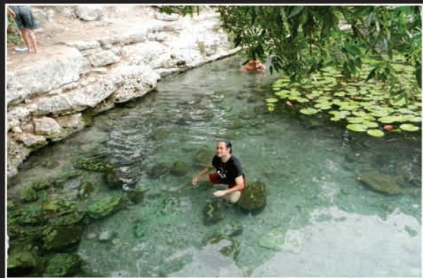
Arriba: El hermoso Cenote Xlakah.