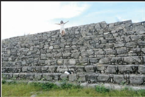
Arriba: Las imponentes construcciones Mayas