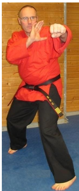
GM Anders Falck

Programa detallado en: www.acudo.org/documents